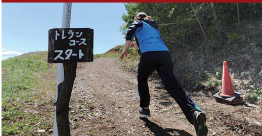
トレイルランニング